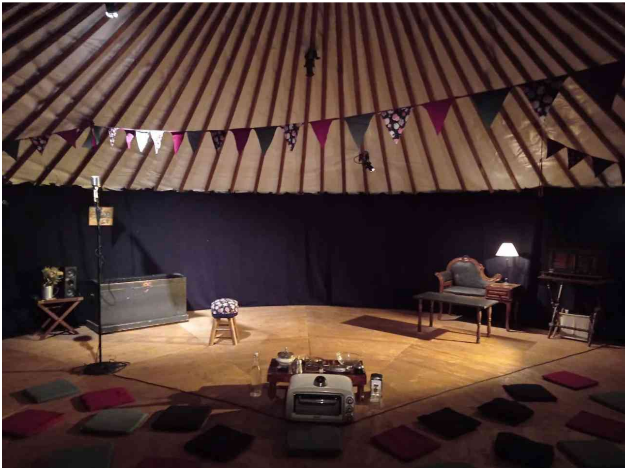
Espace scénique type - Dori